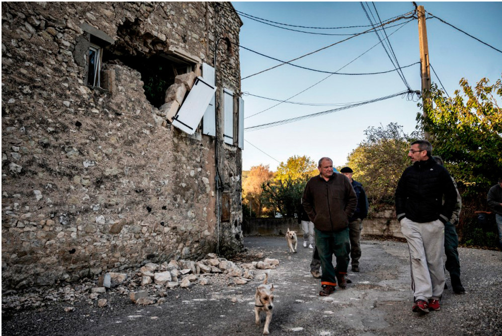
Ces habitants de la ville du Teuil, en Ardèche, observent leurs maisons abîmées par le tremblement de terre.

Lundi, les habitants de la région de Montélimar ont senti la terre trembler fort sous leurs pieds. Ce séisme a fait plusieurs blessés, et abîmé de nombreux bâtiments. La France est-elle souvent touchée par des tremblements de terre ? Et que fait-on lorsque cela arrive ? 1jour1actu t'explique tout.