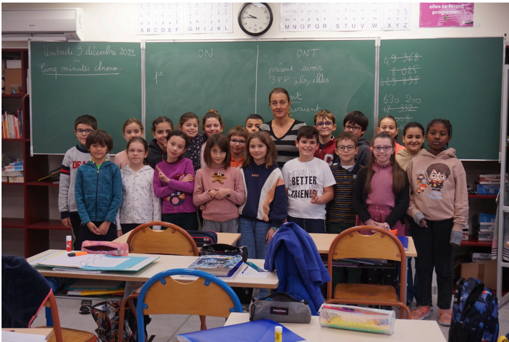
La classe de CM1 de l'école du Petit Train, près de Toulouse.

Depuis plusieurs mois, le gouvernement appelle les Français à économiser un peu d'énergie chaque jour, pour éviter d'en manquer cet hiver. Les enfants, leurs parents et leurs enseignants peuvent trouver des astuces pour participer à cet effort. 1jour1actu a demandé aux CM1 de l'école du Petit Train, près de Toulouse, quelles étaient leurs idées.