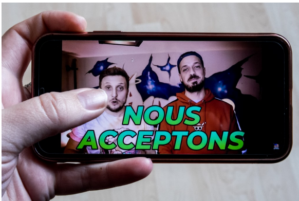
Les youtubeurs McFly et

Carlito ont relevé le défi lancé par Emmanuel Macron.