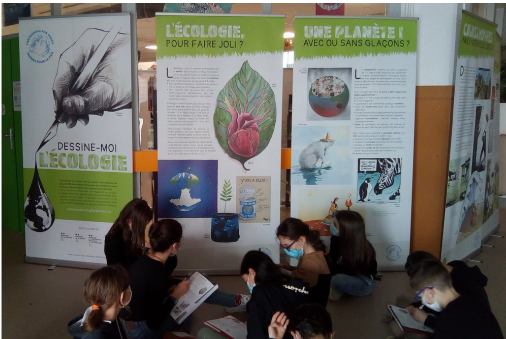
Dans un collège du Sud-Ouest de la France, ces élèves de sixième étudient l'exposition « Dessine-moi l'écologie ».

Du 22 au 27 mars, c'est la Semaine de la presse et des médias dans l'école. Des activités sont proposées dans les écoles, les collèges et les lycées, pour apprendre aux élèves à bien s'informer. Pour l'occasion, l'association Cartooning for Peace propose des ateliers et des expositions sur les dessins de presse.