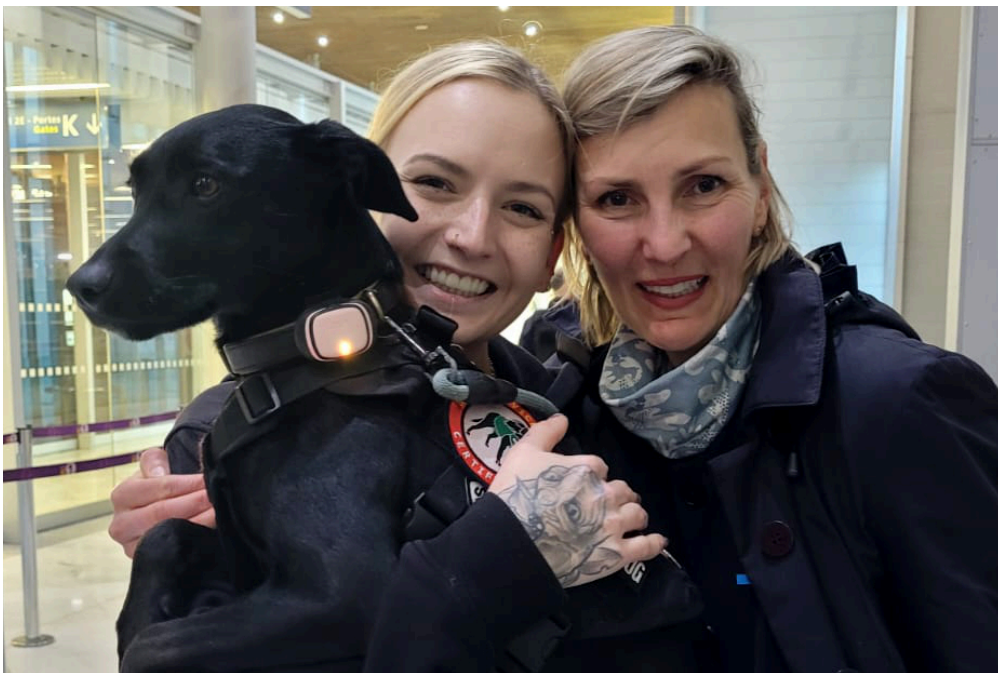
La chienne Amalka dans les bras de sa maîtresse (à gauche) et d'une bénévole qui a aidé à la retrouver.