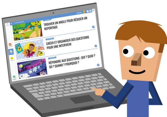
Illustration : Guillaumit.

Quand tu arriveras sur la page d'accueil de la plateforme, tu auras accès ? trois espaces différents :