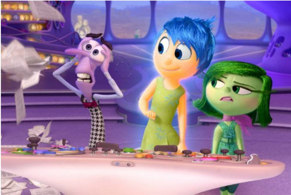
Peur, Joie et Dégoût aux commandes du cerveau de la jeune Riley. (2015 Disney Pixar)

Vice-versa plonge le spectateur dans un endroit où il ne pourra jamais aller en vrai : dans le cerveau d'une fillette de 11 ans. Inventif, original et fascinant, c'est LE film d'animation de l'été.