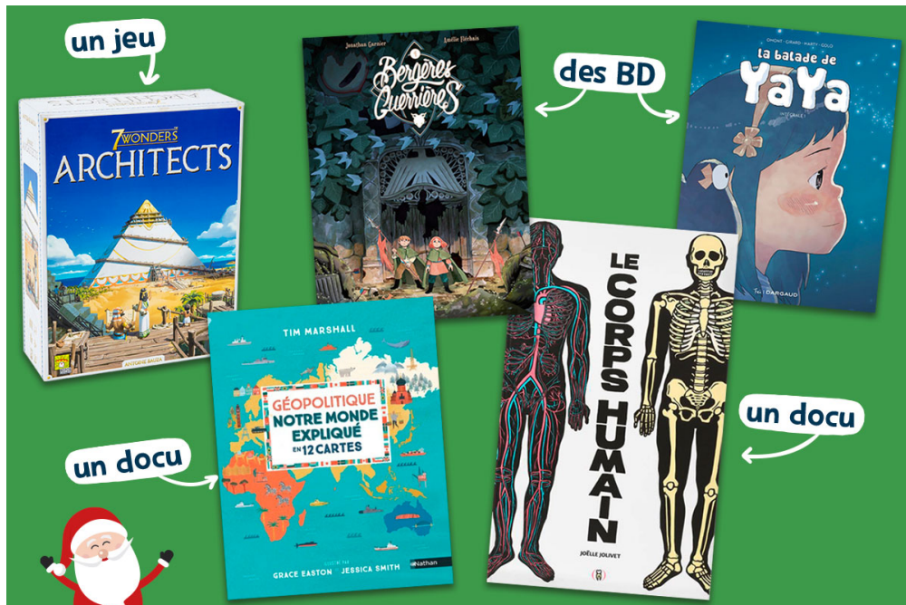
(© Vincent Gire / Milan Presse.)

Bientôt Noël ! Si tu cherches des idées pour compléter ta liste au Père Noël, 1jour1actu a sélectionné pour toi 1 jeu, 2 BD et 2 docs. De l'architecture à l'Antiquité jusqu'au corps humain détaillé, il y en a pour tous les goûts !