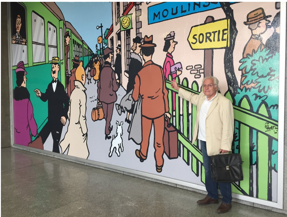
L'humoriste et écrivain Albert Algoud, passionné de Tintin, était l'invité des p'tits journalistes.