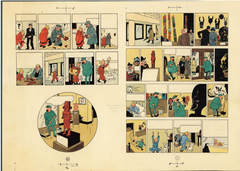
Une planche de L'oreille cassée, datant de 1956. © Hergé-Moulinsart 2016