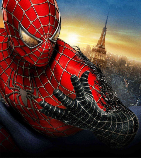
Spider man 3