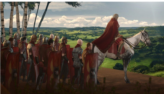
Le Dernier Gaulois

Ce soir, c'est France 5 qu'il faut regarder pour découvrir une belle histoire mais aussi les dures conditions de vie des habitants dans une région de l'Himalaya, située entre l'Inde et le Tibet, dans Himalaya, l'enfance d'un chef à 20 h 40.