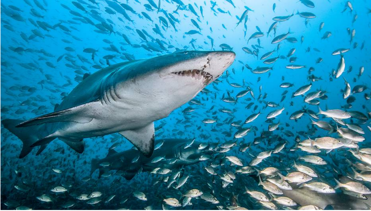
Dans le sillage des requins

Tout le monde est fatigué après le réveillon et s'endort devant la télé ! Bon d'accord, on regarde Sister Act à 15 h 30 et Sister Act 2 à 16 h 50 sur M6 mais ensuite on file dormir !