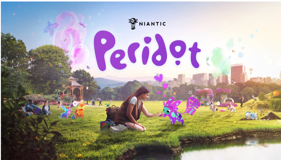
Illustration de Peridot © Niantic

Niantic, les créateurs de Pokémon GO et Pikmin Bloom , ont récemment partagé leur nouveau jeu mobile en réalité augmentée: Peridot . Ici, le but est d'élever et de prendre soin de Dots, d'adorables créatures imaginaires . En te baladant, tu vas rencontrer des créatures, t'en occuper, et même les accoupler pour obtenir de nouvelles espèces. L'intention de Niantic est d'offrir un «réel» animal de compagnie à tous ses joueurs. Comme pour Tamagotchi , le but est simplement de t'occuper de tes nouveaux amis afin de créer un lien unique avec chacun d'entre eux. Ce jeu mobile sera disponible gratuitement sur Android et iOS . Malheureusement, nous n'avons pas encore la date officielle de sortie de Peridot . Mais, ne t'inquiète pas, toute l'équipe d' 1jour1actu te tiendra au courant! En attendant, tu peux demander à tes parents de s'inscrire sur la liste de pré-téléchargement du jeu.