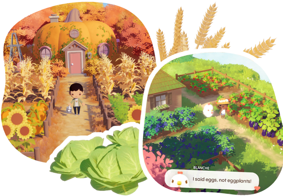
Screen du Gameplay

Une cagnotte en ligne est même en cours pour en terminer la conception. Tu ne sais pas ce qu'est une cagnotte en ligne?? Il s'agit d'un système qui permet à n'importe qui de présenter un projet pour qu'on l'aide à le financer. Les personnes intéressées, quelles qu'elles soient (tes parents, un voisin, un prof, etc.), envoient de l'argent pour que l'entreprise puisse lancer son projet. PuffPals: Island Skies a déjà récolté plus d'un million d'euro et la cagnotte continue jusqu'au 7 mai.