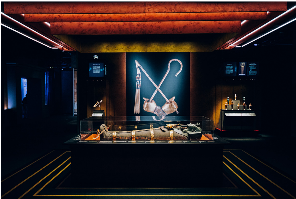
L'exposition « Toutânkhamon, le trésor du pharaon » dévoile 150 objets trouvés dans la tombe du célèbre pharaon.

Des bijoux, de l'or, des meubles en bois précieux... le trésor du pharaon Toutânkhamon est le plus fabuleux jamais découvert. Pourquoi est-il si exceptionnel ? Et que nous apprend-il sur l'Égypte des pharaons ? Réponses avec Dominique Farout, un égyptologue qui a travaillé sur l'exposition « Toutânkhamon, le trésor du pharaon », visible en ce moment à Paris.