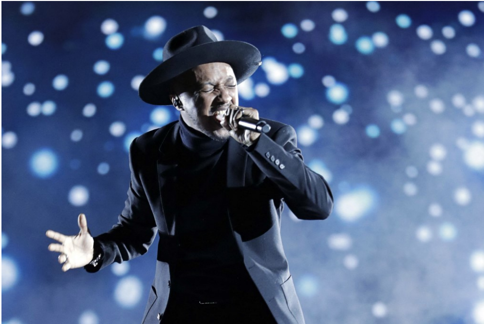
Beaucoup d'enfants adorent les chansons de Soprano. Et toi ?

Ce mardi, c'est la Fête de la musique?! Des concerts gratuits sont prévus partout en France. Pour l'occasion, 1jour1actu est allé à la rencontre des élèves de CM1 de l'école du Petit Train, près de Toulouse, pour qu'ils te donnent leurs conseils musicaux.