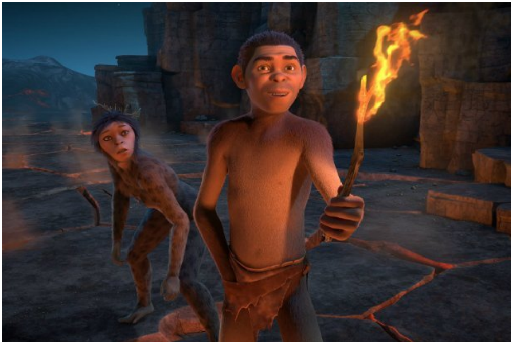
Le premier film de Jamel Debbouze, « Pourquoi j'ai pas mangé mon père »

Pourquoi j'ai pas mangé mon père , le premier film réalisé par Jamel Debbouze, est un exploit ! Réalisé en capture de mouvement comme Avatar , il voit le jour après 7 ans de travail, et c'est une réussite.