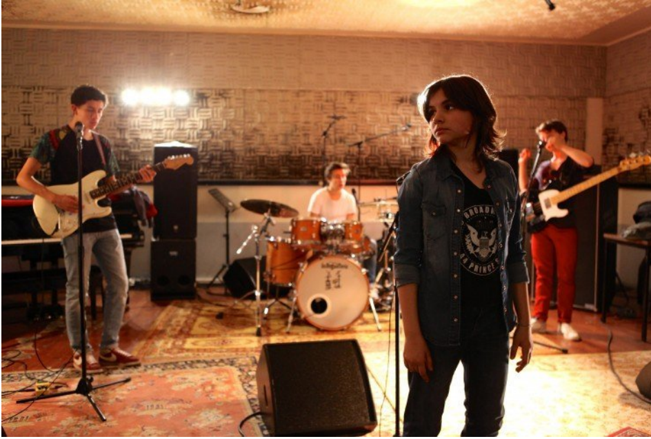
Dans Jamais Contente , Aurore est chanteuse dans un groupe de rock.