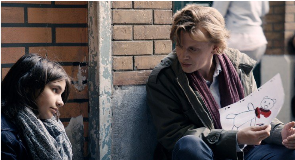
Tout le monde énerve Aurore... sauf son professeur de Français, joué par l'acteur Alex Lutz.

Jamais contente change des films que l'on voit d'habitude sur les pré-adolescents . Adapté d'un livre à succès – Le Journal d'Aurore , de Marie Desplechin –, il n'accumule pas les gags pour faire rire à tout prix. Il essaie, simplement, de parler de leurs problèmes – l'amitié, l'amour, les cours... – avec le plus de réalisme possible .