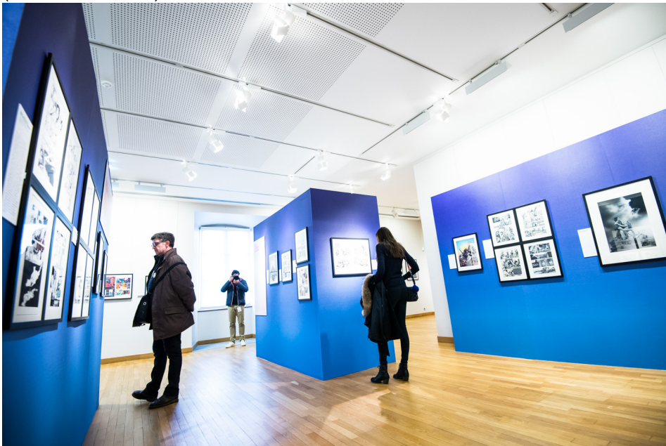
Le festival d'Angoulême, en 2020.