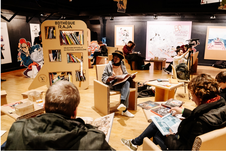
Le festival d'Angoulême, en 2020.