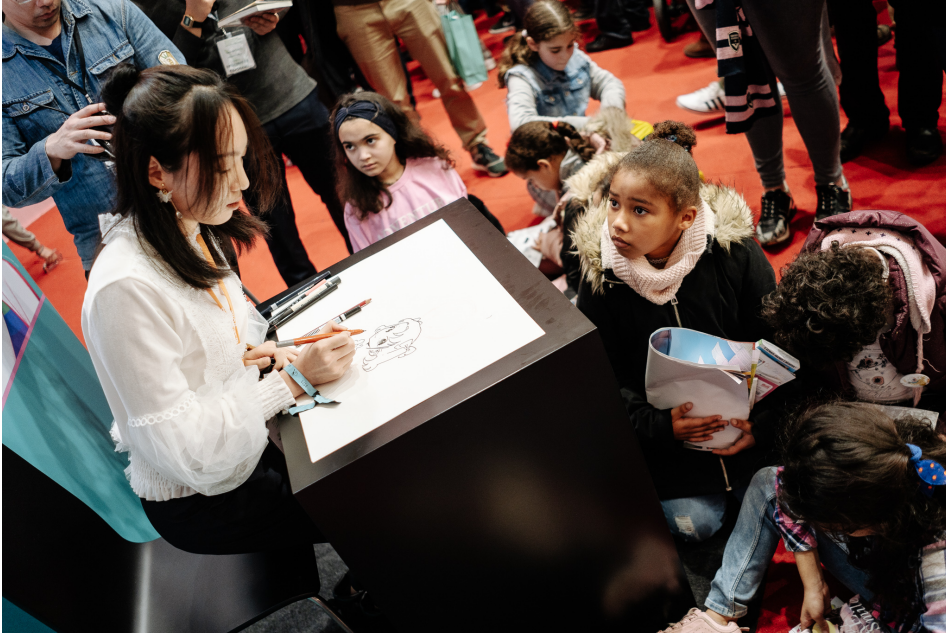
Le festival d'Angoulême, en 2020.

Tu veux en savoir plus sur le festival d'Angoulême ? Alors découvre la suite de l'interview de Roxanne dans ton hebdo 1jour1actu n° 346, qui paraît le 18 mars.