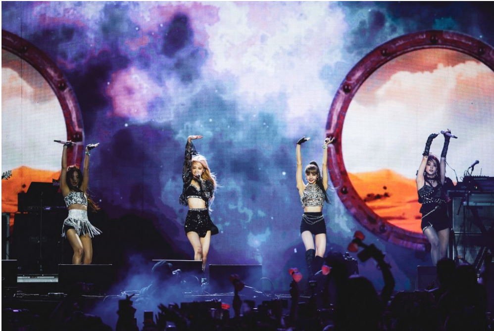
Le groupe coréen Blackpink fait un concert, lors d'un festival aux États-Unis, en 2019.

Cette semaine, pour préparer ton hebdo, l'équipe d'1jour1actu a enquêté sur la culture de la Corée du Sud. Voici les vidéos de K-pop, la musique pop coréenne, que nous avons le plus aimées. Et toi, quelles sont tes préférées ?