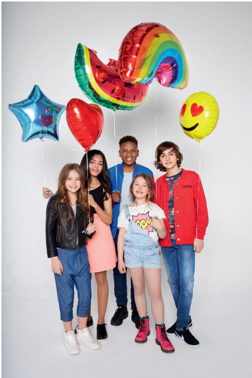
Le groupe Kids United au complet.

Céline Dion, en concert aux États-Unis, en juillet 2016.Et à la 3e place... On trouve les Kids United, les chouchous d'1jour1actu (et des ses lecteurs...). Ils ont vendu leur dernier album « Tout le bonheur du monde » à plus de 400 000 exemplaires. Félicitations à eux !