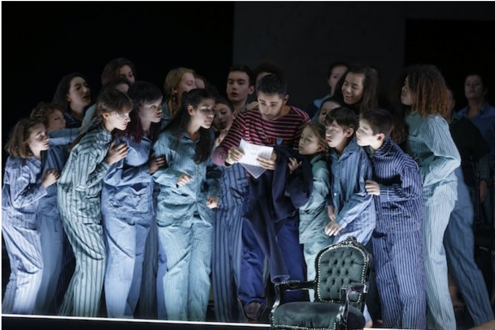
La Maîtrise du Capitole, dans une mise en scène d'Un Bal masqué.

À Toulouse, où est réalisé ton journal, 1jour1actu s'est rendu dans les coulisses de l'Opéra de la ville, à la rencontre de la Maîtrise du Capitole. Ce chœur d'enfants, exceptionnel, va t'en mettre plein les oreilles !