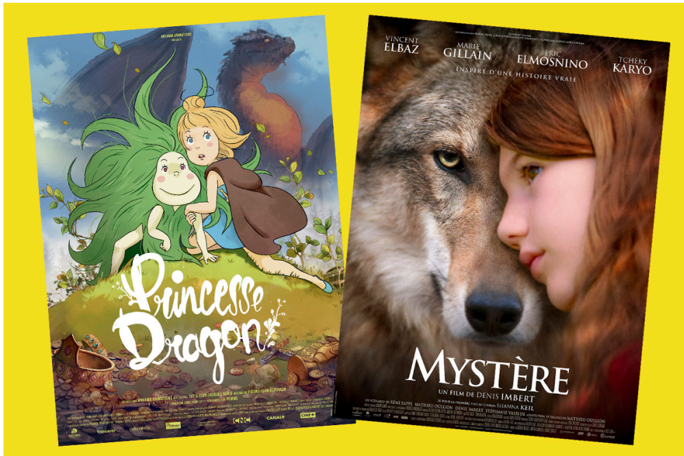
( Princesse Dragon : © Gebeka Films – Mystère : © Radar Films – Solar Entertainment – Gaumont – Auvergne-Rhône-Alpes Cinéma)

Dans Mystère , un drame émouvant, une fillette toute triste se console grâce à un loup, son meilleur ami. Il est aussi question d'amitié dans le formidable Princesse Dragon , où une sauvageonne qui crache du feu et une princesse luttent ensemble pour leur liberté.