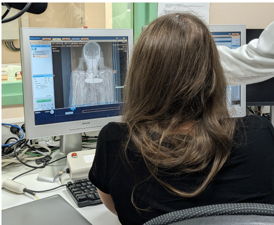
Voici une image du squelette de la momie réalisée grâce au scanner.

Tout m'intéressait, et bien-sûr l'Égypte, les pharaons, les pyramides... Mais j'aimais surtout les sciences et la technologie. Et aujourd'hui, j'avoue que j'aime l'idée d'associer cette momie si ancienne avec cet appareil médical si moderne. C'est un décalage qui me touche, et, surtout, qui fait avancer les connaissances.