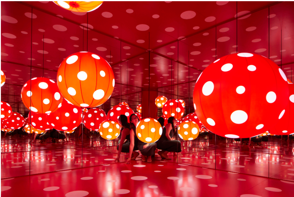
Cette visiteuse se promène dans l'une des œuvres de Yayoi Kusama, dans l'exposition de Manchester, en Angleterre.

Connais-tu Yayoi Kusama?? Cette artiste japonaise conçoit des œuvres colorées, amusantes et souvent monumentales. De grandes expositions lui sont consacrées en ce moment : dans la ville de Manchester, en Angleterre, et à Bilbao, en Espagne.