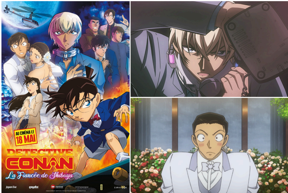
(© 2022 Goshō Aoyama/Detective Conan Committee All Rights Reserved.)

Adoré au Japon, d'où il vient, et de plus en plus connu en Europe, le lycéen détective tente de retrouver un terroriste dans ce nouveau film d'animation, le 25e qui lui est consacré.