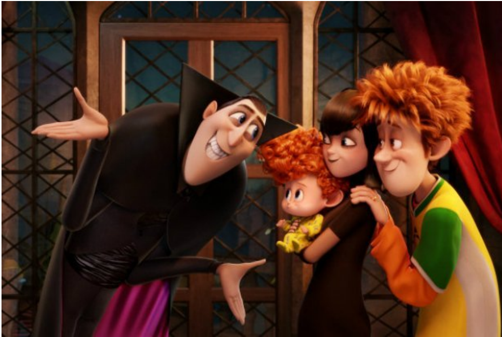
le film » Hôtel Transylvanie 2 » (Sony Pictures Animation)

Au ciné, ce mercredi : Hôtel Transylvanie 2 , un dessin animé « monstrueusement drôle », et, plus sérieux, La Forteresse , un beau film sur un garçon de 11 ans qui vit en Inde. 1jour1actu te livre ses « critiques ciné ».