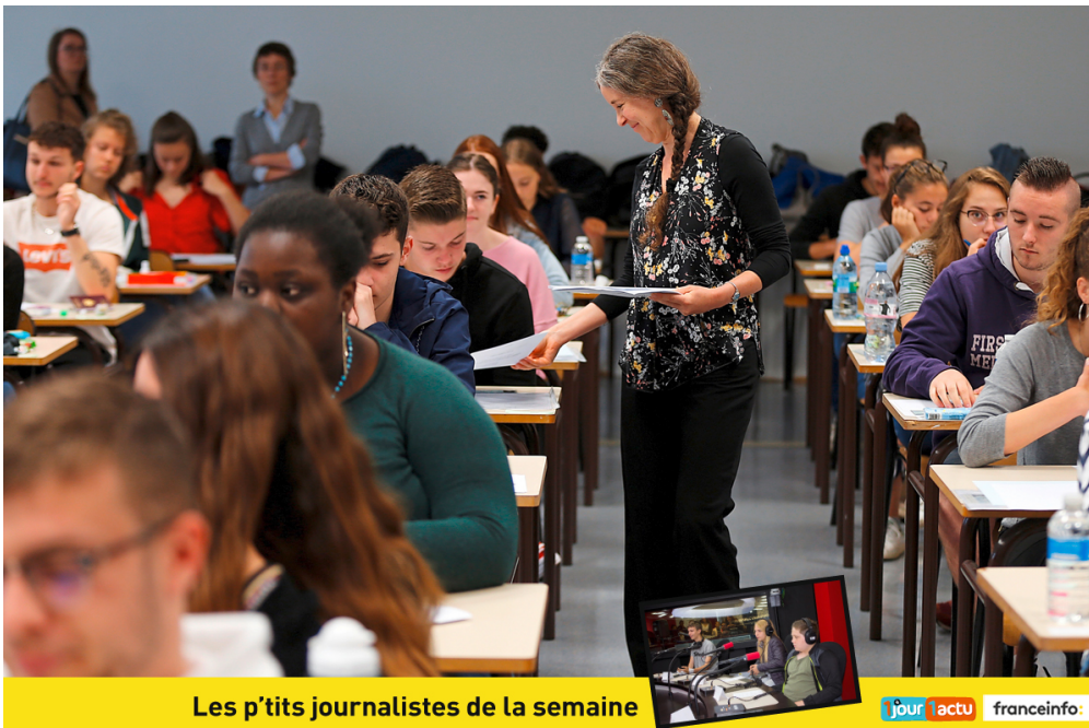
Les p'tits journalistes de la semaine

Les épreuves du baccalauréat ont débuté lundi dernier. Et, comme chaque année, les élèves de terminale ont commencé cette période d'examens avec l'épreuve de philosophie. Mais, au fait, sais-tu à quoi ça sert de philosopher ? Cette semaine, les p'tits journalistes de franceinfo junior ont posé la question à un philosophe !