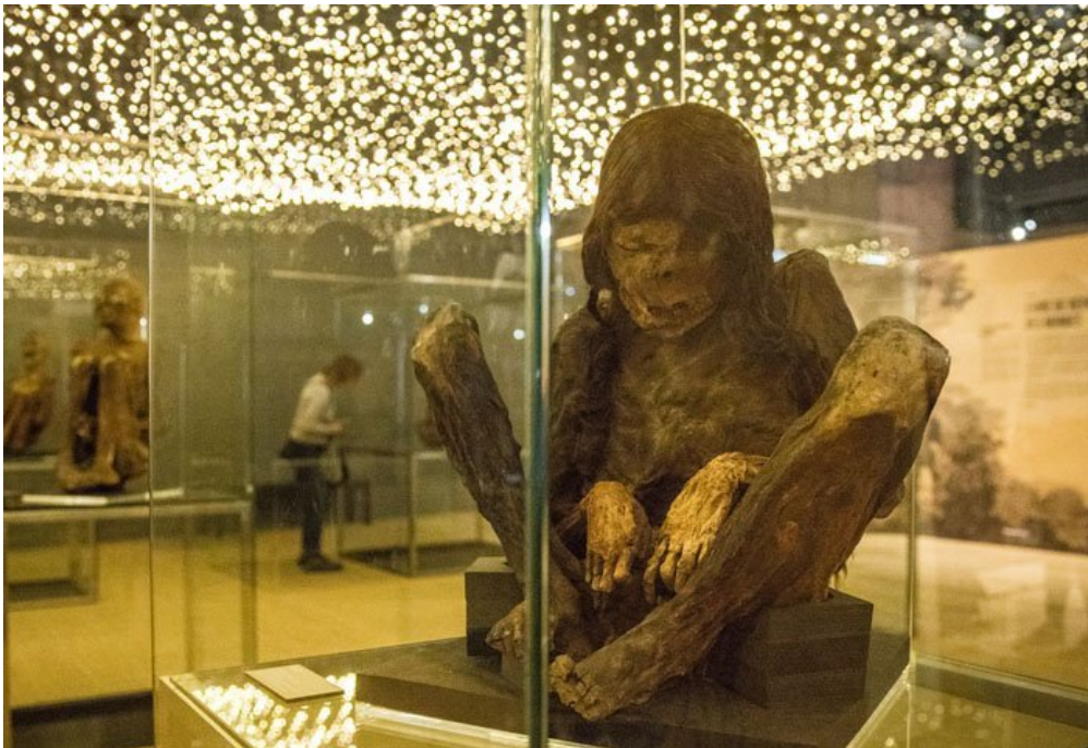
(© Vincent Gire / Milan presse)

Les pharaons Toutankhamon ou Ramsès II, la reine Hatchepsout... C'est en Egypte qu'ont été découvertes les plus célèbres momies. Mais sais-tu qu'autrefois, dans d'autres pays, on conservait aussi les corps des gens après leur mort ? Découvre ce monde mystérieux grâce à l'exposition « Les momies ne mentent jamais » que tu peux voir jusqu'au 5 mars à Bordeaux.