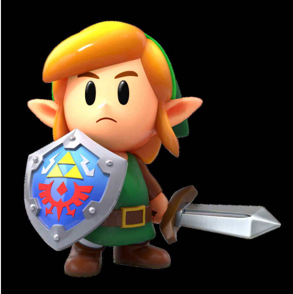
L'aventurier Link, dans le jeu Link's Awakening sur Switch. (© Nintendo)

moins de 12 ans. C'est parce qu'ils contiennent des images effrayantes et violentes, qui peuvent choquer les enfants. Si tu veux découvrir Zelda , 1jour1actu te conseille Link's Awakening : une version de ce jeu est sortie en 2019 sur la console Switch.