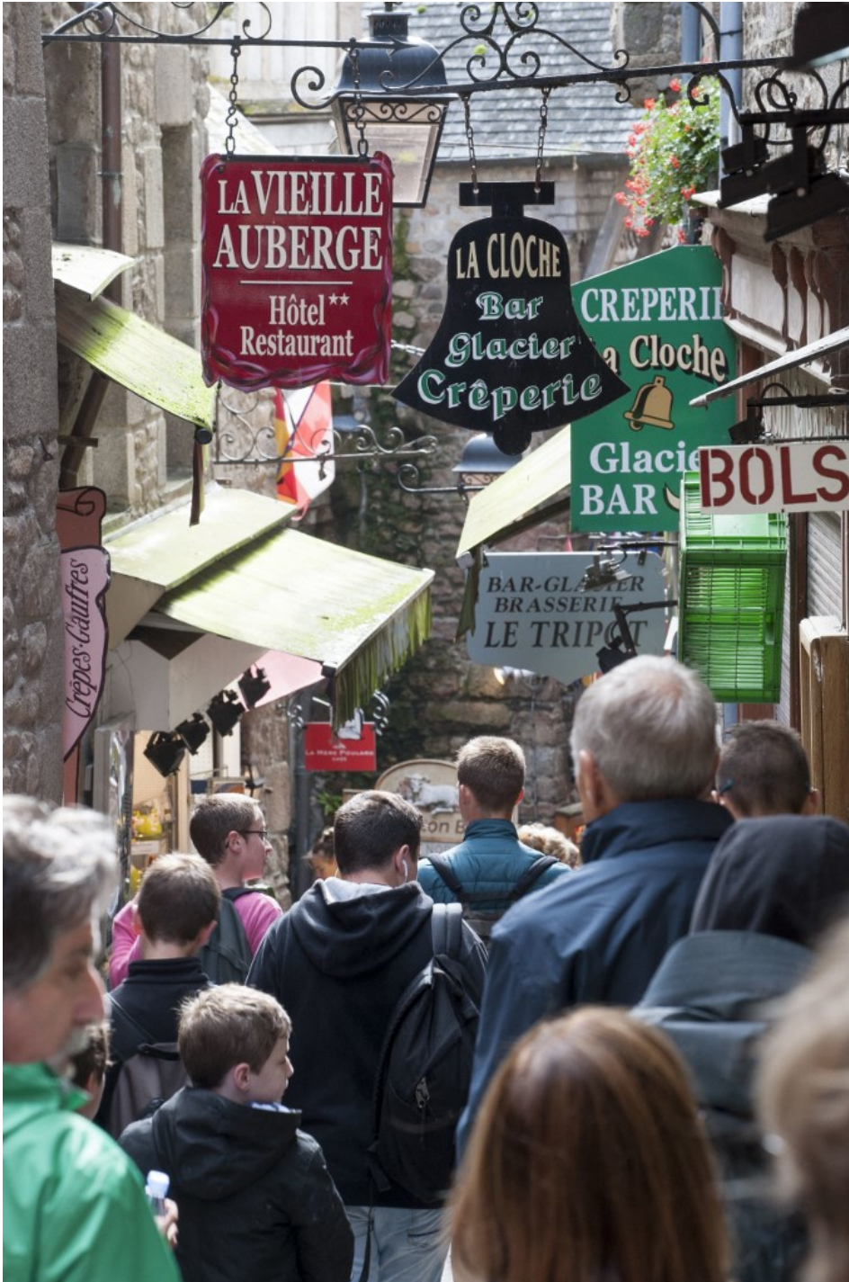
Des touristes se promènent dans une rue du Mont-Saint-Michel.

La statue de saint Michel sert de paratonnerre